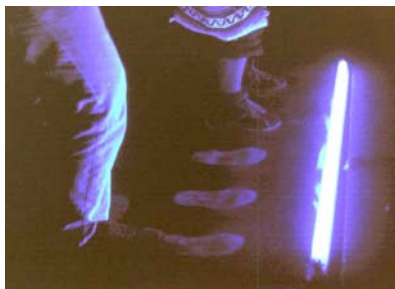
Abbildung 3: Die Steuerung der Bewegungen Aeginas über eine drucksensitive Fußmatte