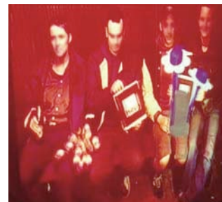
Abbildung 4: FlirtBank (im „Spiegelbild“: AR-Toolkit-Karten und virtuelle Objekte sichtbar)