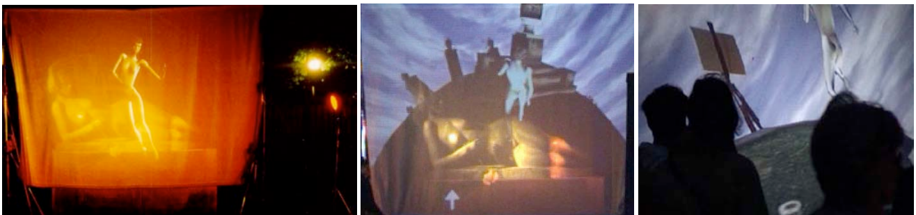
Abbildung 2. Bildserie: Aegina erwacht zu Leben, steht auf und beginnt ihren Planeten zu begeh.